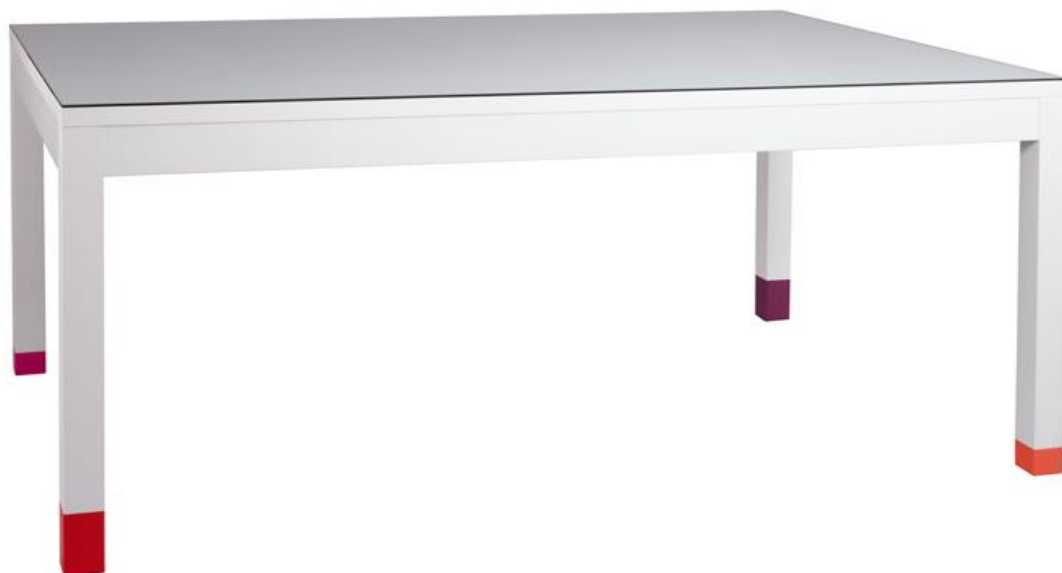
TABLE DE REPAS LAQUEE

Dans un design simple et élégant, la table de repas Pied-Riez est faite de bois laqué. Sa signature est reconnaissable aux cubes de couleur qui terminent chaque pied. Une plaque de verre protège la surface laquée. La table Pied-Riez existe dans 2 formats standards ou en dimensions sur mesure. Finition laque multicouche couleurs sur mesure.