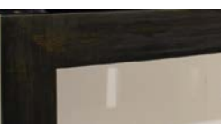
Acier patiné Patinated steel