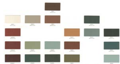
Pied en acier thermolaqué large gamme de couleurs.