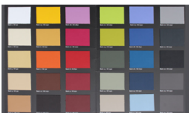
SKILL - Simili cuir grainé