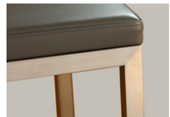
Pied en inox brossé polissage à 45°. Brushed stainless steel.