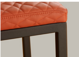
Pied en acier thermolaqué noir, toucher grainé. Black coated steel.