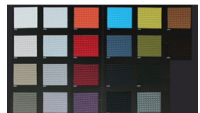
AUREA sculpture - Simili cuir en damier