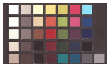
EXTREMA AU - Simili cuir lisse