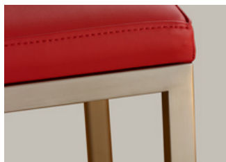
Pied en inox brossé polissage estompé. Brushed stainless steel.