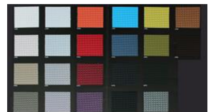
SKILL - Simili cuir grainé