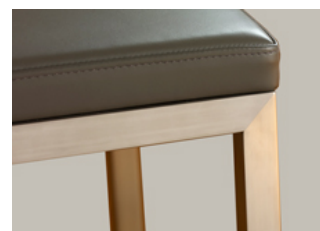
Pied en inox brossé polissage à 45°. Brushed stainless steel.