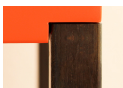
Pied en acier patiné noir brun. Patinated steel.