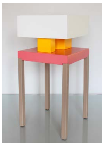
Table de chevet design / Bedside table