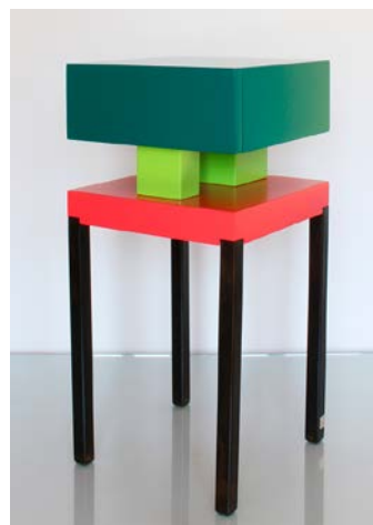
TABLE DE CHEVET DESIGN EN COULEURS

Le chevet Pied-de-Grue est un petit meuble de rangement personnalisable. Il est composé d'un pied en métal et d'un empilage de cubes laqués. Le cube supérieur est fermé ou tiroir. Couleurs sur mesure. 100 % fabrication française. Disponibilité 6 à 8 semaines. Livrée montée.