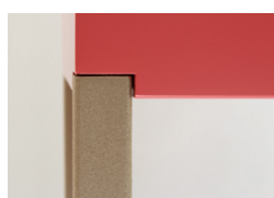
Pied en acier thermolaquée beige doré, toucher grainé. Beige coated steel.