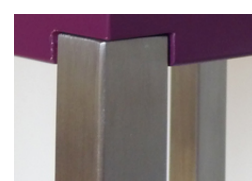
Pied en inox brossé polissage estompé. Brushed stainless steel.